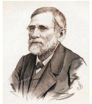
Portret z „Tygodnika Ilustrowanego” 1881 r.

Oskar Kolberg wydał 33 tomy monografii regionalnych i tematycznych, opublikował około 200 artykułów z zakresu etnografii, folklorystyki, językoznawstwa, muzykologii. Spuścizna Oskara Kolberga stanowi nadal niezbędną materiałową podstawę, do której odwołują się obecnie realizowane projekty twórców i badaczy kultury”. W 2014 r. mija 200 lat od urodzin wybitnego badacza polskiej kultury ludowej. Oskar Kolberg urodził się 22.02.1814 r. w Przysusze k.Radomia. Zmarł w Krakowie w 1890 r. Rok Kolberga ma przypomnieć zarówno jego postać, jak i olbrzymie dzieło naukowe pozostawione kolejnym pokoleniom. Nad dorobkiem wielkiego uczonego czuwają dwie instytucje: Instytut Oskara Kolberga w Poznaniu oraz Muzeum im. Oskara Kolberga w Przysusze, będące oddziałem Muzeum Wsi Radomskiej. Warto poinformować, że w dniach 22-23 maja 2014 r. odbędzie się w Poznaniu międzynarodowa konferencja naukowa pt. „Dzieło Oskara Kolberga jako dziedzictwo narodowe i europejskie”.