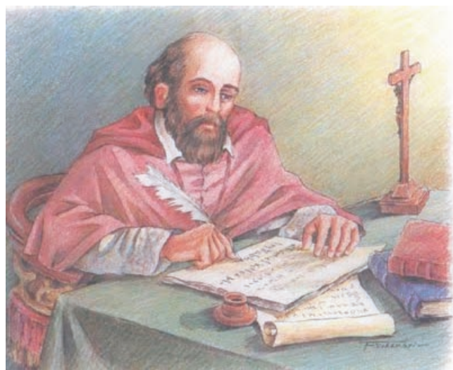
Św. Franciszek Salezy patron dziennikarzy

W 2003 r. Stowarzyszenie Obywatelskie w Ursusie podjęło decyzję wydawania własnego pisma bezpłatnego pod nazwą „Ursus”. Obecne wydanie gazety nosi numer 50.