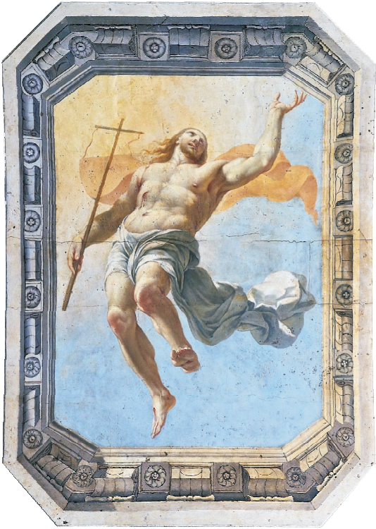
Michel Corneille Starszy-fresk z paryskiego kościoła Saint-Nicolas-des-Champs.

Drodzy Czytelnicy, Parafianie i wszyscy Mieszkańcy naszej Dzielnicy.