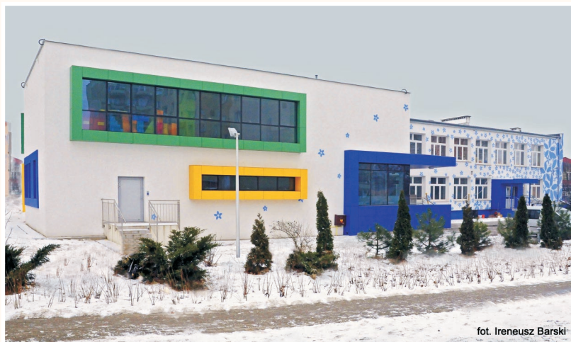
fol. Ireneusz Barski

Prezentujemy Państwu rozbudowane Przedszkole nr 219 przy ul. Keniga 20, które powiększyło się o cztery oddziały. W placówce przeprowadzono dodatkową rekrutację na rok 2011/2012. Od 1 marca 2012r. edukację rozpocznie 113 dzieci. Do przedszkola zostały przyjęte dzieci dla których zabrakło miejsca podczas wiosennego naboru. Wszystkim dzieciom życzymy aby czuły się tu jak w domu i w pełni skorzystały z bogatej oferty dydaktycznej natomiast Dyrekcji i wszystkim pracownikom satysfakcji z wykonywanej pracy.