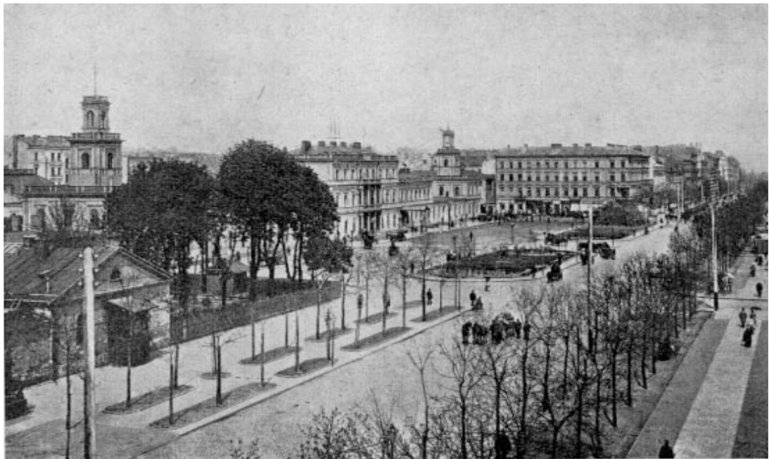
Dworzec kolei Warszawsko-Wiedeńskiej, przed I wojną światową