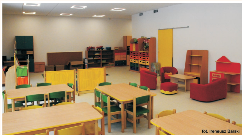
fol. Ireneusz Barski