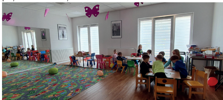
Dzieci ukraińskie podczas zajęć edukacyjno-kulturalnych w czasie dziennego pobytu w Domu Kultury "Miś".