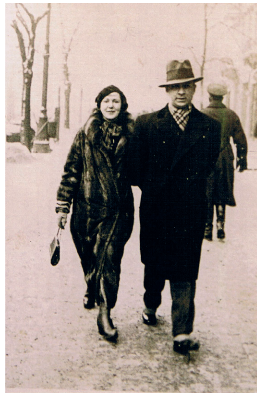
Stabryłowie na spacerze - lata trzydzieste XX wieku.