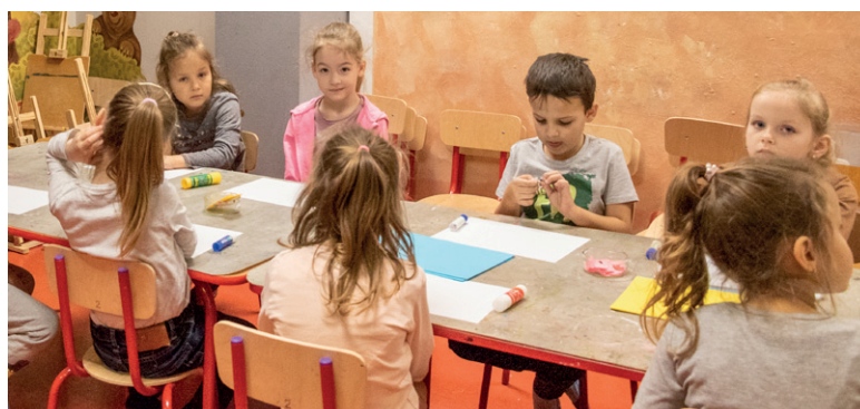
Dzieci ukraińskie podczas zajęć edukacyjno-kulturalnych w czasie dziennego pobytu w Domu Kultury "Portiernia".

Dziękuję Panu bardzo za rozmowę i przekazanie wiadomości na temat obecności uchodźców.