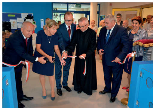
Otwarcie przedszkola przy ul. Balbinki

Tego dnia zostało również oddane do użytku nowo wybudowane skrzydło Przedszkola nr 200 „Gąska Balbinka”. Piękne, nowe sale zachwyciły nie tylko najmłodszych, ale również rodziców. To kolejna dotrzymana obietnica.