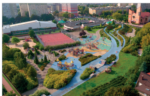
Projekt Centrum lokalowego na osiedlu „Niedźwiadek”