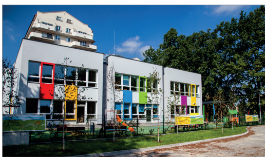
Nowe przedszkole przy ul. Achera