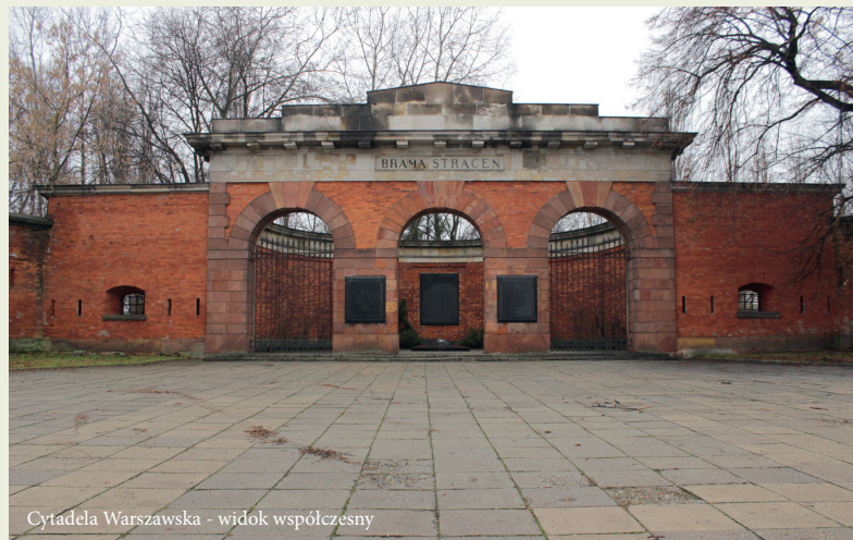
Cytadela Warszawska - widok współczesny

Zdzisław Zajączkowski Przewodnik warszawski