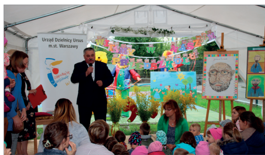
Otwarcie przedszkola przy ul. Wojciechowskiego