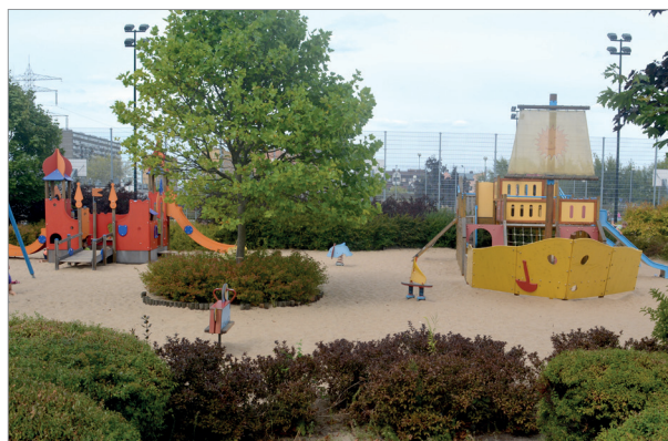
Place zabaw w dzielnicy Ursus

Historia magistra vitae Historia jest nauczycielką życia