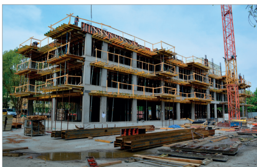
Budowa bloku komunalnego przy ul. Zgłoby