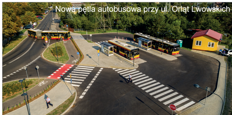
Nowa pętla autobusowa przy ul. Orłąt Lwowskich