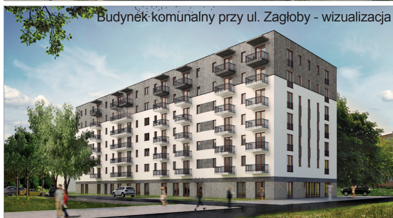
Budynek komunalny przy ul. Zagłoby - wizualizacja