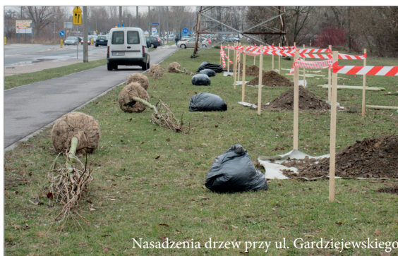
Nasadenia drzew przy ul. Gardziejewskiego

Zadania własne powiatu obejmują sprawy o charakterze ponadgminnym. Zadania własne województwa określane są jako tworzenie strategii rozwoju regionu i prowadzenie polityki jego rozwoju. Realizacja tych zadań (własnych i zleconych) jest możliwa poprzez struktury władz samorządowych. Władze samorządowe to organy stanowiące i kontrolne. Do rady gminy jako organu stanowiącego i kontrolnego należą wszystkie sprawy pozostające w zakresie działania gminy. Mogą one powoływać tzw.