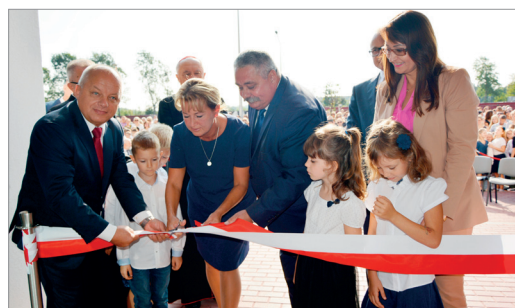
Otwarcie Szkoły SP nr 360

Amerykański poeta i satyryk Mark Twain wypowiedział pamiętne słowa: Lepsza złamana obietnica niż żadna . Doskonale wpisują się one w obecną rzeczywistość – z nieukrywaną radością dodam - nie naszej dzielnicy. 3 września odbyła się inauguracja roku szkolnego w szkole, która była największą inwestycją ostatnich lat w Ursusie. Budowie tego kompleksu przyglądaliśmy się z dużą troską i towarzyszyliśmy od samego początku. Składane interpelacje i zapytania radnych Stowarzyszenia Obywatelskiego w Ursusie w sprawie budowy przy ul. Dzieci Warszawy 42,