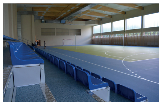
Hala sportowa przy ul. Konińskiej