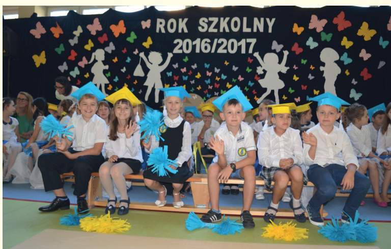
Dzieci z nowootwartej Szkoły Podstawowej nr 4