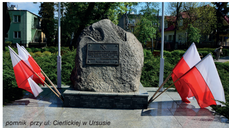
pomnik przy ul. Cierlickiej w Ursusie

Następnie NKWD zaczęło wywozić na Sybir ludność cywilną wraz z rodzinami. Wywózka trwała do napaści Trzeciej Rzeszy na ZSRR. Siły Armii Czerwonej przydzielone do uderzenia na Polskę wynosiły 2,5 mln żołnierzy, 4700 czołgów i 3300 samolotów. Niemcy do ataku na Polskę skierowały 1,5 mln żołnierzy,