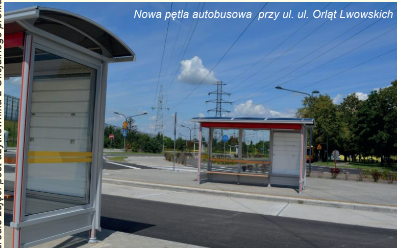
Nowa pętla autobusowa przy ul. ul. Orłąt Lwowskich