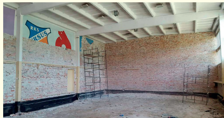
Remont budynku klubu sportowego na terenie Ośrodka Sportu i Rekreacji w Ursusie

W wakacje zaczął się remont chyba ostatniego „pomnika” minioniej epoki, tj. budynku klubowego i sali sportowej na terenie Ośrodka Sportu i Rekreacji Dzielnicy Ursus. Dzięki staraniom radnych m.in. Stowarzyszenia Obywatelskiego i władz dzielnicy, po ponad czterdziestu latach obiekt przechodzi generalny remont. To właśnie tu klika pokoleń młodych mieszkańców Ursusa trenowało w sekcji akrobatyki sportowej, najpierw w RKS Ursus Warszawa, a teraz UTS Akro-Bad Warszawa, zdobywając medale Mistrzostw Świata, Mistrzostw Europy i Mistrzostw Polski we wszystkich zawodach współzawodnictwa sportowego. Remont ma potrwać do końca listopada tego roku. Około 300 członków klubu czeka na zakończenie tej inwestycji.