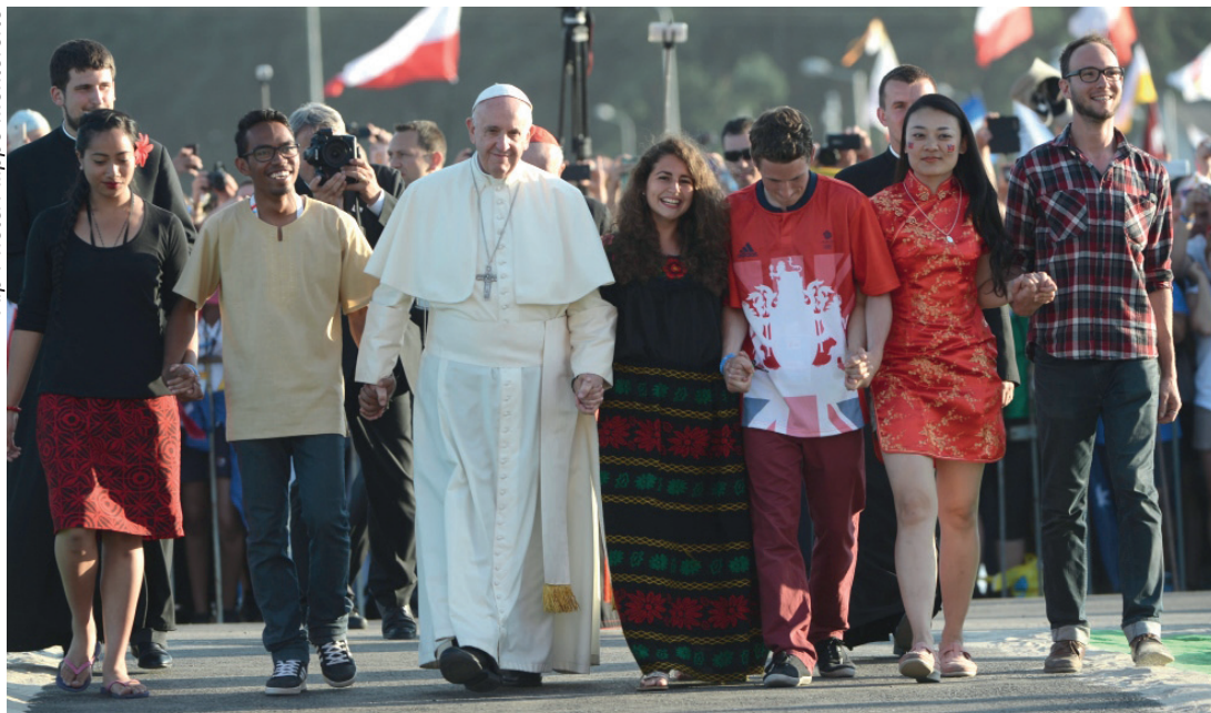
Papież Franciszek przechodzi przez Bramę Świętą z przedstawicielami sześciu kontynentów podczas wieczornego czuwania modlitewnego na Campusie Misericordiae w Brzegach pod Krakowem podczas Światowych Dni Młodzieży, 30 lipca 2016

kimi jesteśmy, i żaden grzech, wada czy błąd tego nie zmieni. Nikt nie jest gorszy i daleki, nie ma człowieka bez znaczenia, ale wszyscy jesteśmy dla Boga umiłowani i ważni. Bóg kocha nas bardziej, niż my kochamy samych siebie, wierzy w nas bardziej, niż my wierzymy w siebie, zawsze nam „kibicuje” jako najbardziej niezłomny z fanów. Smutek nazywa „wirusem”, który zaraża i blokuje wszystko. Wskazał na wielki dar, jakim jest „Kochać i być kochanym”.