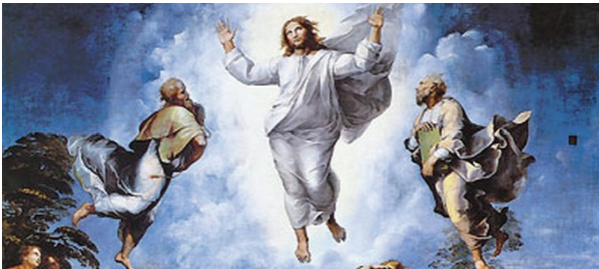
Gdyby Chrystus nie zmartwychwstał, próżna byłaby nasza wiara (por. 1 Kor 15,14)

Drodzy Czytelnicy, Parafianie i wszyscy Mieszkańcy naszej Dzielnicy, Przed nami radosny Poranek Zmartwychwstania, który przypomina nam, że na nic się przydały pieczęcie, straże i pieniądze, żeby zatrzymać prawdę, iż Chrystus Zmartwychwstał. ON ożywił i umocnił wiarę załamanych apostołów i uczynił ich świadkami swojego zwycięstwa nad śmiercią, grzechem i szatanem. Życzę, by światło poranka wielkanocnego rozjaśniało także nasze codzienne ciemności, problemy i niepokoje. W roku 1050-lecia Chrztu